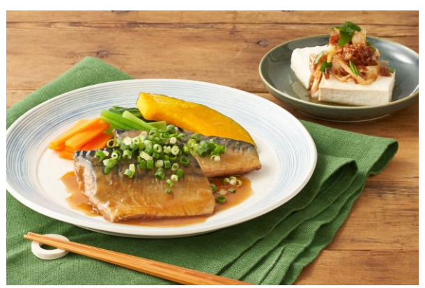
▲小ねぎ香る、さばのみぞれ煮