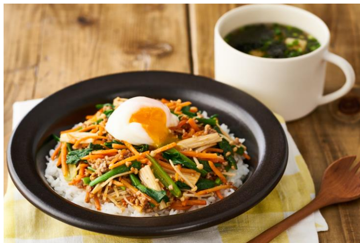
▲ Kit Oisix売り上げNo.1商品 「そばろと野菜のビビンバ」

※2021年7月8日～2022年6月30日に出荷したKit Oisixのセット数を集計（量目違いは合算）