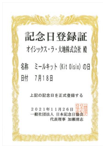
▲「ミールキット (Kit Oisix) の日」記念日登録証

利用者は順調に推移しており、Oisix定期会員346,083人のうち、65%にあたる226,594人が定期的にKit Oisixが届く「Kit Oisixコース」に登録しており、前年同期比で25%増加しています（2022年3月末時点）。