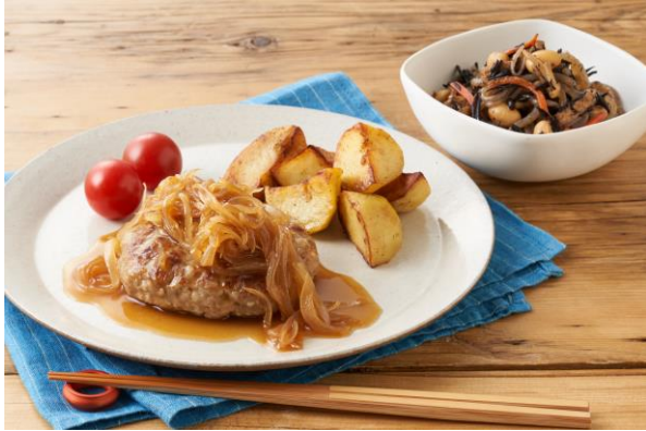
▲たっぷり玉ねぎソースの和風バーグ