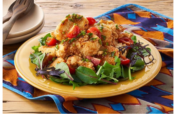
▲チキンフライのサルサ風