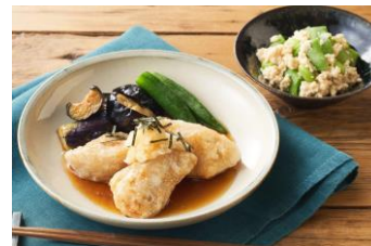
▲ Kit Oisix「サメ肉竜田揚げ 生姜入り出汁仕立て」

気仙沼に主に水揚げされるヨシキリザメとモウカザメのうち、ヨシキリザメは、ヒレをとったあと骨はパウダー、正肉はすり身にするなど捨てることなく活用されていますが、モウカザメの身は水分が多くすり身にむかないため、ヒレをとったあとの正肉は有効活用できず未利用の状況でした。水分が多い分、熱を通すと固くなりにくくしっとりとした食感になる特徴をいかし、オリジナルメニューとして商品化。衣付けした竜田揚げを生姜入りの上品な出汁でいただく和のKit Oisixは、淡白でクセがなくふっくらジューシー。これまでサメ肉を食べたことがない方にもおいしくお召し上がりいただけます。