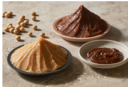
▲オリジナルの味噌だれを開発

仙台味噌と西京味噌をベースに練りごまと太白胡麻油で風味豊かなコクをつけたオリジナルの味噌だれは、ソラノイロのメソッドが凝縮されています。隠し味にメープルシロップを使用し、ふんわりとした甘みを付けました。麺はモチ、ツル食感の国産小麦使用の太ちぢれ麺です。今回の味噌スープと麺がしっかり絡むように開発しました。もやしやコーン、トマトやニラなど彩り鮮やかな野菜※をたっぷり合わせた、満足感あるラーメンです（天候理由などにより、使用する野菜は一部変更になる可能性があります）。