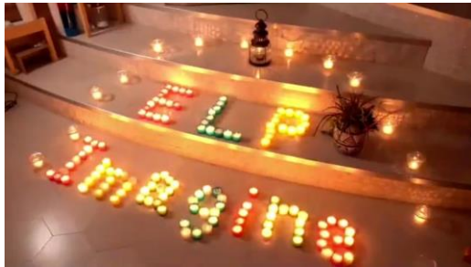
EarthLightProject ( https://earth-light-project.org/ )

初の試みとなる「未来のキャンドルナイトプロジェクト」では、複数の学生グループが企画・運営に参加しています。