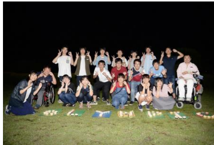
学生団体おりがみ( http://origami-tokyo.com/ )

本プロジェクトでは、未来への想いを込めた動画制作に取り組み、制作した動画はアーティストLIVEで上映する。