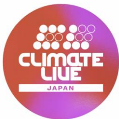
Climate Live Japan ( https://www.climatelivejapan.com/ )

「増上寺七夕まつり 和紙キャンドルナイト」の企画・運営を行なっている。キャンドルで人々の願いや想いを灯し、SNSで発信して共有する。