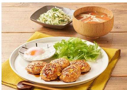
Day4：「とろ〜り温玉のせ甘辛つくね」