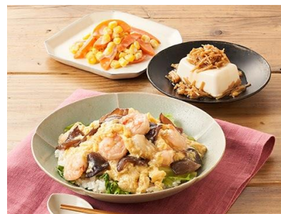
Day5：「えびとレタスの中華あかけチャーハン」