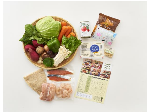
▲セットになって届く5日間分の食材とレシピ