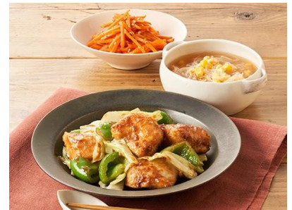
Day3：「やわらかとりむねホイコーロー」 (主菜レタスクラブ監修)