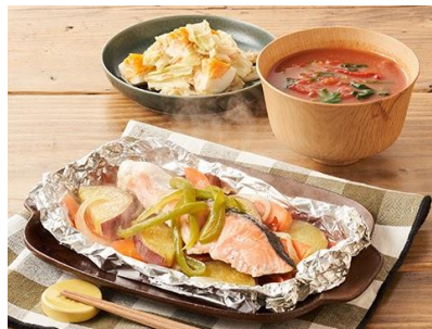
Day2：「鮭とたっぷり野菜のホイル焼き」