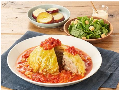
Day1：「巻かないロールキャベツ」 (主菜レタスクラブ監修)