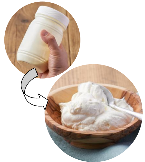
▲生クリームが入った容器を振ると・・・ふわふわホイップバターの出来上がり！