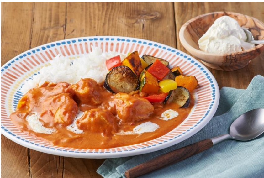
▲小倉優子の手作りバターでチキンカレー

(※)・・・本商品はバター作りの時間を除いて20分で完成する商品となっております。