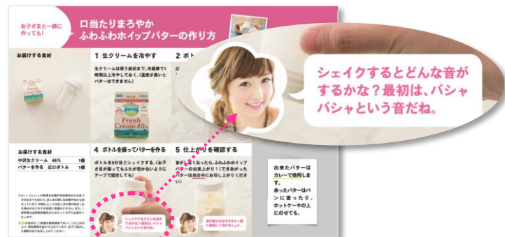
▲ママの声かけポイントを記載。親子のコミュニケーションのきっかけに

一緒にお届けする調理方法を記載した「レシピカード」には、ママがお子さんとのコミュニケーションが取りやすいように、小倉優子流の「声かけポイント」を記載しました。食べ物を観察したり、調理する上でお子さんに対して気遣うべきポイントが記載されています。