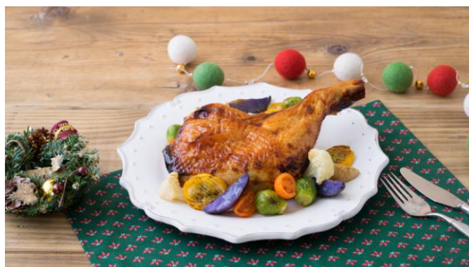
▲骨付き越前白山鶏で！ローストレッグ