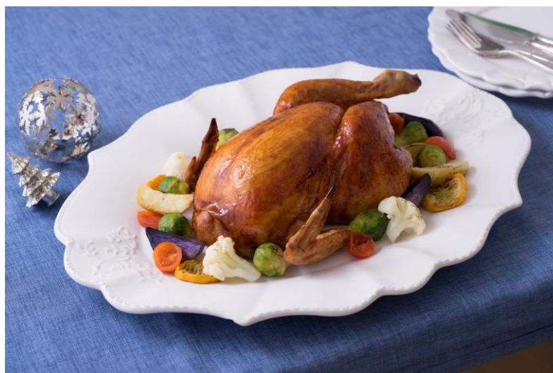
▲たれに漬けこんだ丸鶏をオープンで焼くだけで クリスマスの食卓がぐっと華やぐ一品が完成！