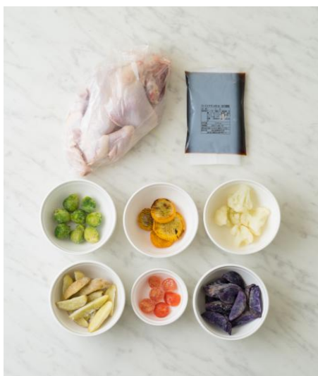
▲丸鶏、漬けだれ、6種類の野菜がセットに

オイシックス株式会社(東京都品川区、代表取締役社長:高島 宏平)では、クリスマス向けローストチキンが作れる冷凍キットを本年12月8日より販売開始したところ、おかげさまで好評につき発売後5日で完売。より多くの皆さまにお楽しみいただくため本日12月15日より再販を開始しました。(販売ページ: https://www.oisix.com/sc/frozenkit )