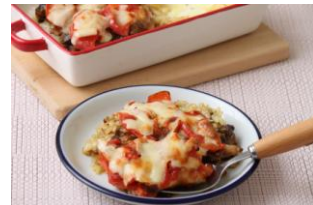
▲アクアパッツアやドリアなど、手の込んだメニューも火を使わずに展開!