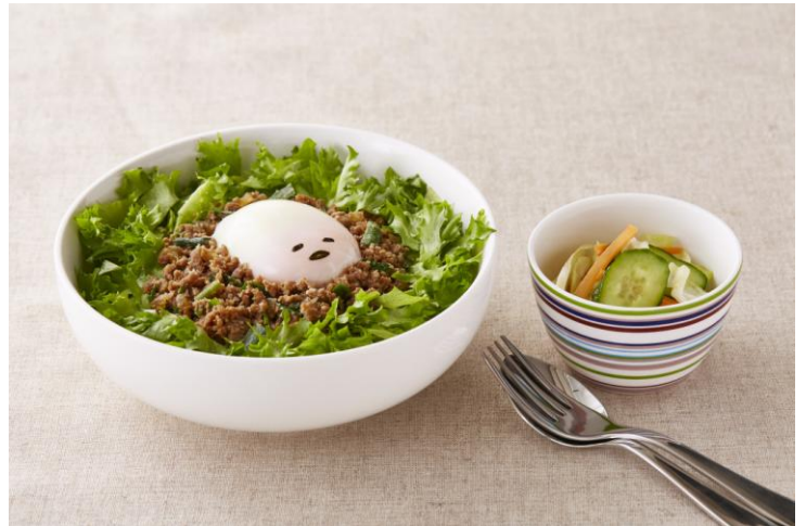
© 2013, 2016 SANRIO CO., LTD. APPROVAL No. G571516