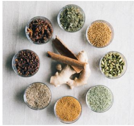
スパイスイメージ