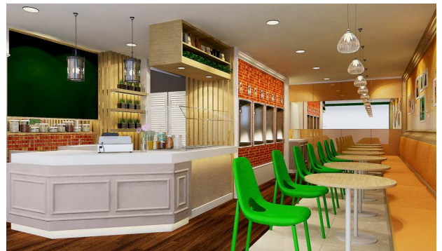
サイアム・パラゴン店イメージ画像

バンコクは、多くの外資の飲食店が参入し、飲食市場が成熟しています。日本の関心度も高いため、多くの日本のスイーツブランドが多く進出していますが、当社が展開するような日本産 100%フローズンヨーグルトで日本式の“おもてなし度”の高い接客サービスを提供する店舗は存在していません。このような理由から、バンコクでのポテンシャルとマーケット創造の余地があると判断し、出店に至りました。まずは、サイアム・パラゴンに出店し、その後1年以内に3店舗程度の出店を計画しています。