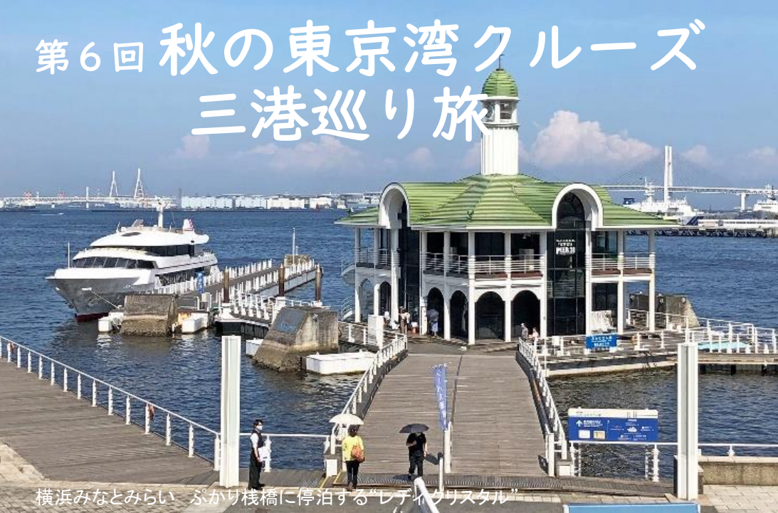
横浜みなとみらい ぶかり棧橋に停泊する“レディ・クリスタル”