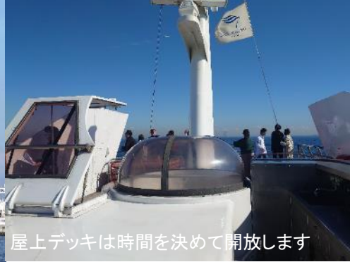
屋上デッキは時間を決めて開放します