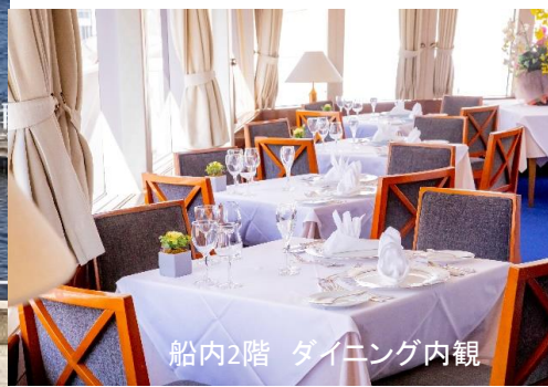
船内2階 ダイニング内観