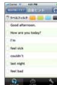
< SVL 単語帳 >

*1) 固有名詞は表示されません。また、動詞の活用形や名詞の複数形については、一部表示されないものがあります。