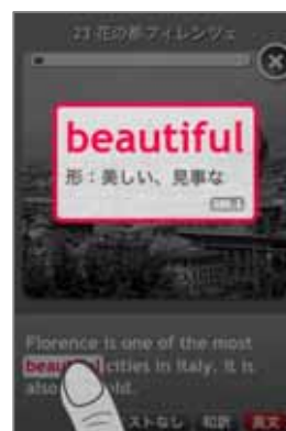
<自由リスニング> 「英文」モードで単語をタッチすると意味が現れます