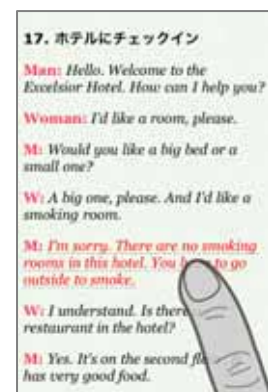
<全文リスニング> タッチした文をスムーズに再生します