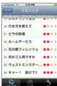
< 難易度付きチャプタータイトル >