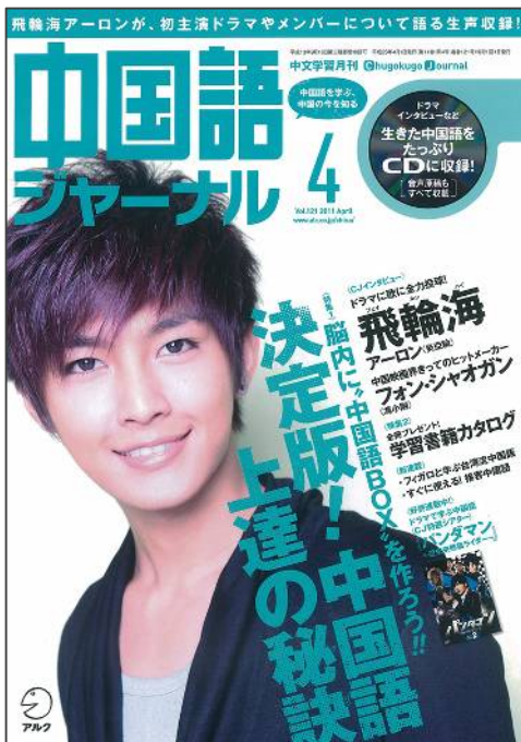
▲表紙の人:アロン(飛輪海<フェイルンハイ>)

その他中国の今や文化を伝える、エンタメやビジネスなどの情報ページ、中国語教育界の著名な講師陣による学習ページなど、盛りだくさんの内容でお届けします。