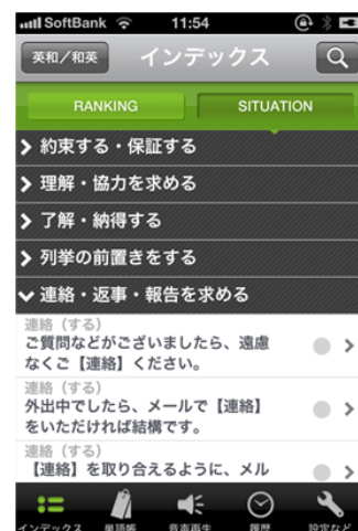
インデックス画面 「シチュエーション」コーナーでは、状況に応じた例文を手早く探し出すことができます。