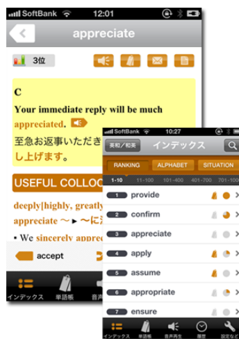
インデックス&キーワード解説画面 検索したキーワードにはビジネスシーンで頻出の例文が表示されます

2008 年度『英辞郎 on the WEB』で最も頻繁に検索された日本語検索キーワード TOP100。よく使うけれど、英文でどう表す? そんな表現が満載です。 3位:検討(する) 2位:確認(する) さて…1位は?