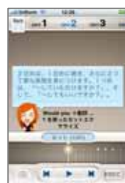
<エクササイズ説明>