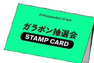
イメージイラスト

期間中、Hisaya-odori Park内店舗をご利用いただくと、ガラポン抽選会のスタンプカードをお配りいたします。スタンプを集めるとガラポン抽選会に参加いただけるチケットとしてご利用いただけます。