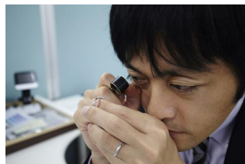
KOMEHYO には約 300 名の鑑定士が在籍

既存のフリマアプリで強化されているアフターサービスではなく、購入前の不安を取り除く鑑定技術＝『ビフォアサービス』で、安心してお買物ができる環境を提供していきます。