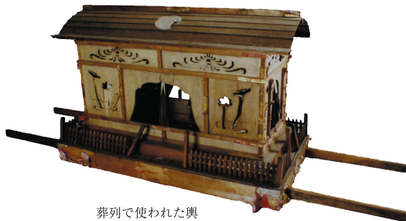
葬列で使われた輿