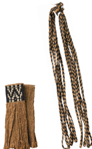
墓標の装飾用の紐