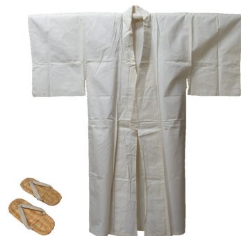
葬式用の草履とシロ（長着）