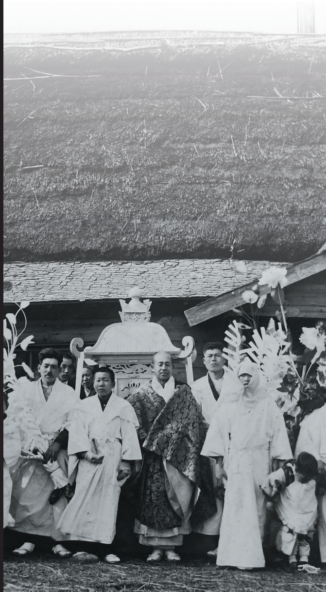
当別町獅子内（昭和11年撮影）

令和6(2024)年10月26日(土)～令和7(2025)年1月13日(月・祝)