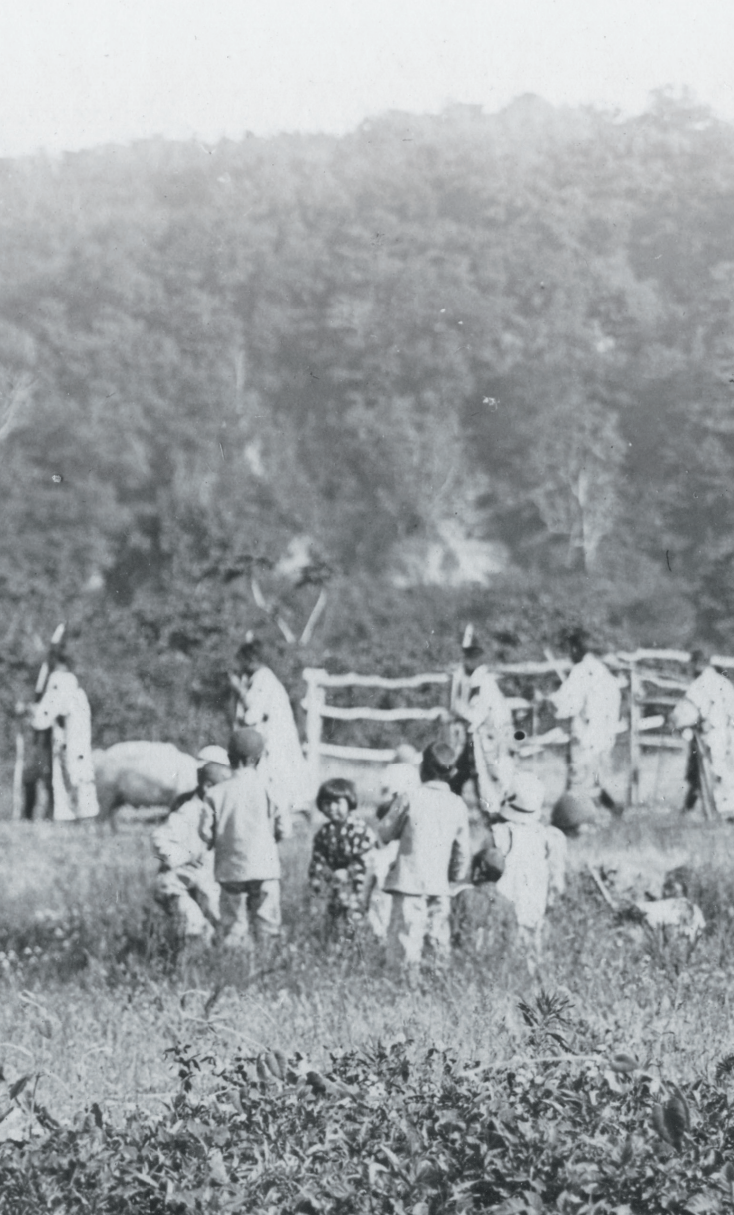
新ひだか町静内（昭和15年頃撮影）