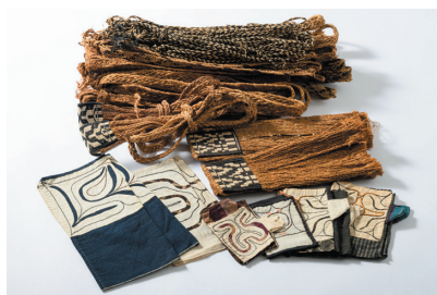
新ひだか町の女性から寄贈されたお葬式用の道具