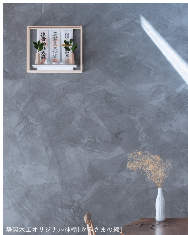
静岡木工オリジナル神棚「かみさまの線」

今回は吉田町から全国に神棚を提案する有限会社静岡木工の協力のもとに神棚や神具を展示いたします。神棚からお神札や神社のこと、神様のことに理解が深まる機会になればと思っています。年始を迎えるこの時期にぜひあらためて神棚に触れてみてください。