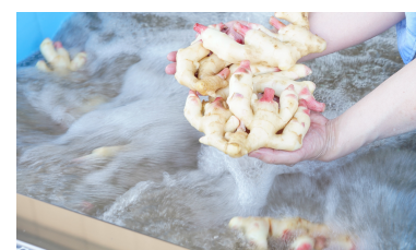
バブルウェーブが奥の汚れまで洗浄

繊細な洗浄物はやさしい水流、しぶとい汚れの洗浄物はパワフルな水流と、ご希望に合わせてバブルウェーブのパワーを思いのままに調整できます。根菜はもちろん、葉物野菜など、洗浄物の幅が広がります。