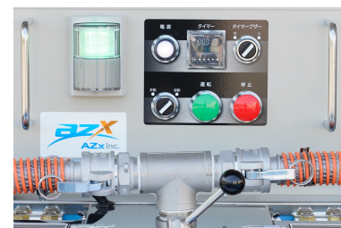
タイマー機能や表示灯がまとまった操作盤

タイマーで洗浄時間を設定してスタートボタンを押せば、あとは洗浄運転から停止まで機械におまかせ。だれでも一定品質の洗浄が実現できます。表示灯とブザーで稼働状況が一目瞭然のため、効率よく作業が行えます。