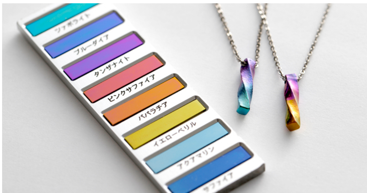
◆電気を電解質溶液の中に流し金属を発色させる