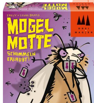
3位いかさまゴキブリ