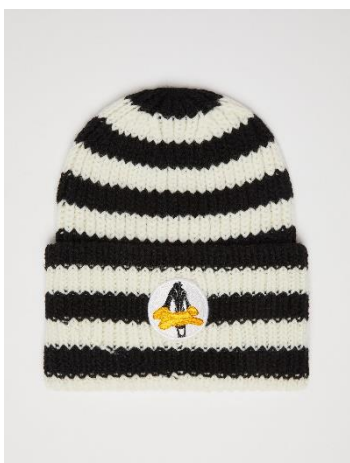
ダフィー・ダック ビーニー ¥19,800-税込