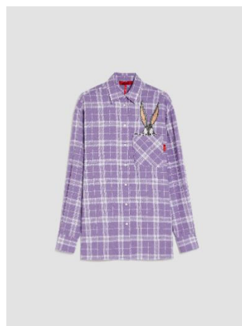
ポケットエンプロダリー フランネルシャツ ¥39,600-税込