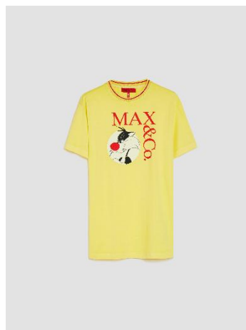
シルベスター Tシャツ ¥39,600-税込