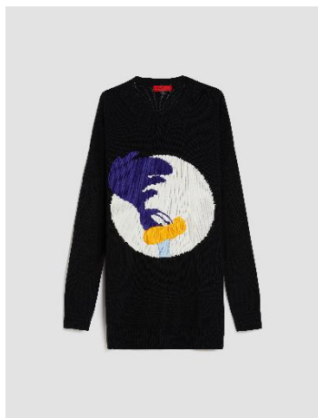
ロード・ランナー エンプロイダリーニット ¥58,300-税込