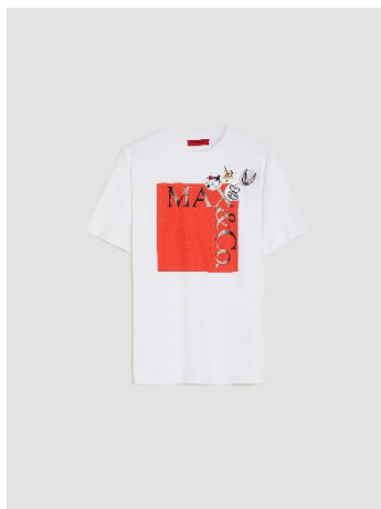
マスコットプリント Tシャツ ¥27,500-税込