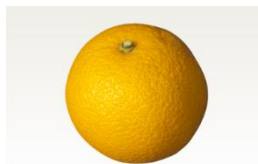
はっさく(和歌山産)

“今が旬”のフロリダ産グレープフルーツと和歌山産はっさくや特産品の美味しさを是非皆さま会場でお楽しみください。