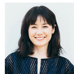
原田 知世 (女優・歌手)