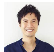
コウケンテツ (料理研究家)