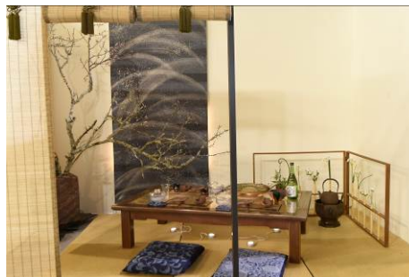
第24回コーディネート部門 大賞・経済産業大臣賞「「乾杯」～from TOKYO」