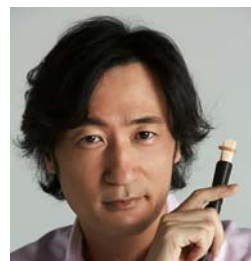
東儀 秀樹 (雅楽師)