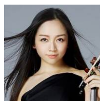
宮本 笑里 (ヴァイオリニスト)