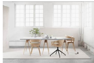
デザインハウス ストックホルム

【展示ブランド】 アラビア、イッタラ、オレフォス、グスタフスベリ、ゲンセ、コスタ ボダ、ジョージ ジェンセン、ダンスク、デザインハウス ストックホルム、ペンティック、リサ・ラーソン、レ・クリント、ロールストランド