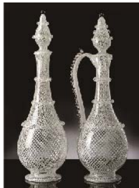
ヴェネツィアガラス