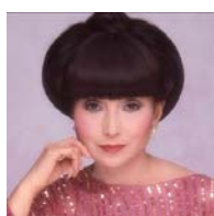
黒柳 徹子 (女優・ユニセフ親善大使)