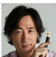
東儀 秀樹 (雅楽師)