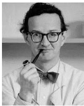
スティグ・リンドベリ

デザインやアートが暮らしに溶け込む北欧。スティグ・リンドベリやリサ・ラーソンを始めとする人気デザイナーが手がけたテーブルウェアやぬくもりのあるヴィンテージ食器の数々をファブリックや家具、照明器具、キッチンウェアと共にご紹介いたします。本イベント初出展となるブランドも必見です。