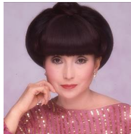
黒柳 徹子 (女優・ユニセフ親善大使)