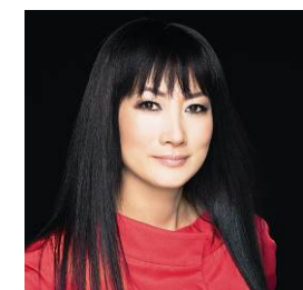
余 貴美子 (女優)