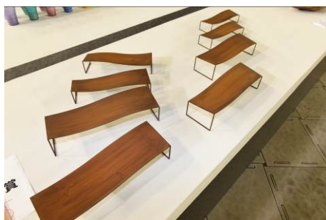
第24回オリジナルデザイン部門 大賞・経済産業大臣賞「「侘び」と「錆び」のカタチ」

また、前回のオリジナルデザイン部門、コーディネート部門の大賞受賞者による、“創り手”と“使い手”のコラボレーション展示も人気が高く、今回も展示する予定です。