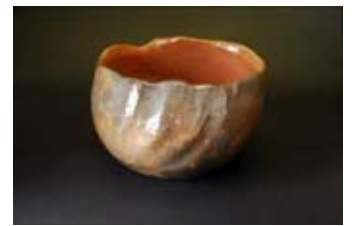
吉村楽入 作 赤楽手捻茶碗 銘「結実」