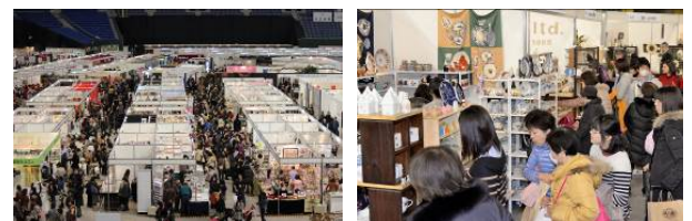
展示販売コーナーイメージ

海外、国内陶磁器及びテーブルウェア関連商品の販売コーナーです。250以上の個性ある販売ブースが出展し、企業の新商品や提案商品、産地の窯元や作家の作品などを直接購入することができるコーナーです。毎年楽しみに来場されるお客様が多くいらっしゃいます。