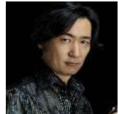
東儀 秀樹 (雅楽師・作曲家)