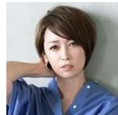
辺見 えみり (タレント)