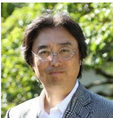
十五代 酒井田柿右衛門 (柿右衛門家当主・陶芸家)

詳細ページ： https://www.tokyo-dome.co.jp/tableware/stage/