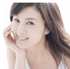
藤原 紀香 (俳優・ NPO【Smile Please☆世界子ども基金】主宰)