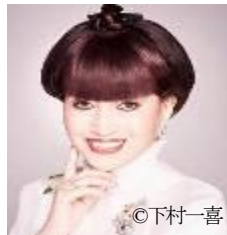
黒柳 徹子 (女優・ユニセフ親善大使)