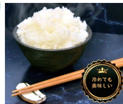
西谷っ米 2キロ 5名様