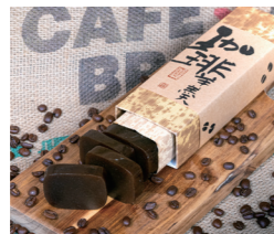
珈琲羊羹 1棹 3名様