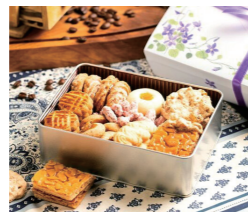
プチフルシュクレ 1缶 2名様