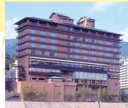
ホテル若水 ペア宿泊券(2食付) 1名様