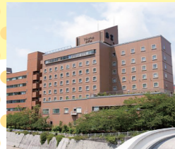
宝塚ワシントンホテル ペア宿泊券(朝食付) 2名様