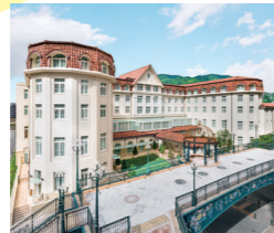
宝塚ホテル ペア宿泊券(朝食付) 2名様