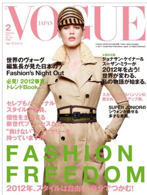
VOGUE JAPAN 2012年2月号