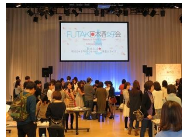
※画像は昨年の様子です

毎回ご好評をいただいている、女性限定の日本酒試飲会イベント「FUTAKO日本酒女子会」が、およそ1年ぶりに開催されます。今回は、スピンオフ企画「新潟 meets FUTAKO日本酒女子会」として、酒どころ新潟の銘酒にフィーチャーします。さらに、「日本酒+ビューティー」をテーマに、さまざまなゲストによるトークショーも予定。日本酒初心者の方も楽しめます。