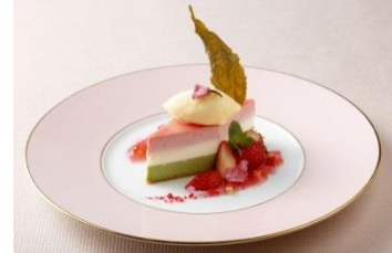
※画像はひな祭りディナーのデザートです