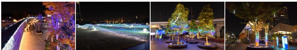
リボンストリート