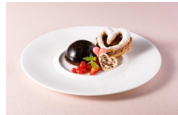
※画像はバレンタインディナーのデザートです