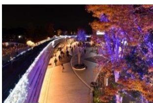
リボンストリート