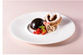
※画像はバレンタインディナーのデザートです

4日間限定で特別バレンタインディナーをご用意しました。 コース料理のデザートには、濃厚なチョコレートムースと ピンクのハート型マカロン、チョコレートクリームをサンドした ハート型パリプレストを1つのお皿でいろいろ楽しめます。 お二人の大切なひとときをお楽しみください。 女性の方だけでも大歓迎！