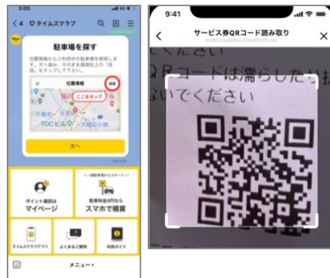
▲リッチメニュー イメージ

*4 事前にタイムズクラブ LINE 公式アカウントの友だち追加が必要になります。