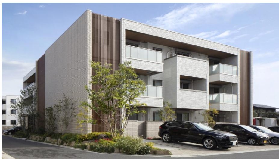
賃貸住宅「シャームゾン」に併設する駐車場を有効活用

積水ハウス株式会社とタイムズ24株式会社、タイムズモビリティ株式会社は、積水ハウスの賃貸住宅「シャームゾン」に併設する駐車場に、タイムズの駐車場シェアリングサービスおよびカーシェアリングサービスを全国規模で展開する業務提携契約を締結いたしました。3社の連携により、ライフスタイルの変化に合わせた駐車場の新たな価値提案と、サービスの拡大による利用者の利便性向上を目指します。サービス導入は、2021年6月より順次開始してまいります。