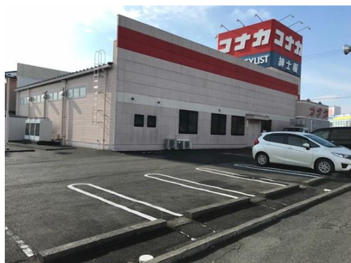
▲「紳士服コナカ 佐沼店」