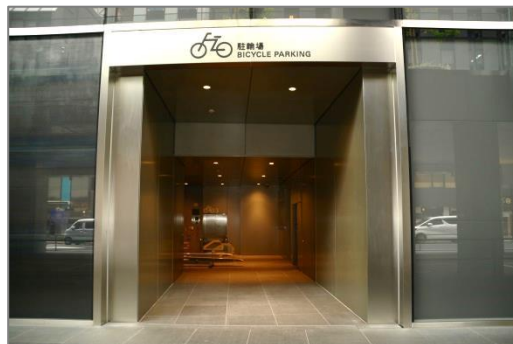
▲GINZA SIX 駐輪場