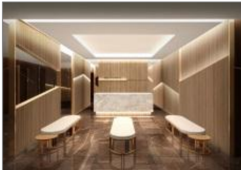
▲サービスカウンターイメージ