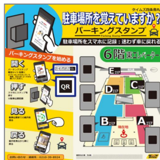
② エレベーターホールなどに設置しているパーキングスタンプボードのQRコードからサイトにアクセス