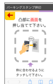
④ 自身の駐車エリアのスタンプを画面にタッチ