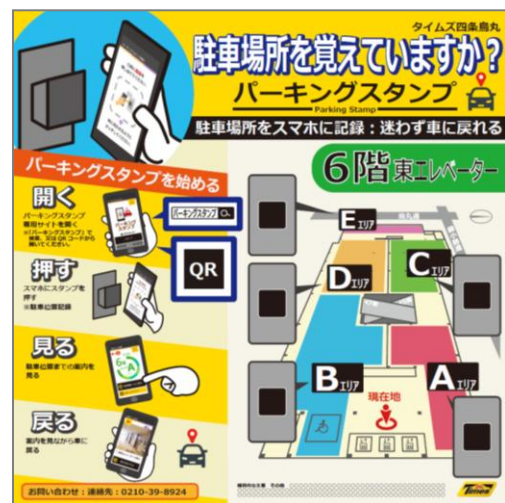
▲6階エレベーターホールに設置する パーキングスタンプボード

パーク24は今後も、ストレスのない快適なクルマ社会の実現に向け、ドライバーの皆さまのニーズに対応したサービスを提供できるよう取り組んでまいります。