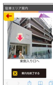
⑦ 駐車場付近で⑥画面の「駐車場所への案内」をタップし押し、画面上の指示に従い駐車場所へ