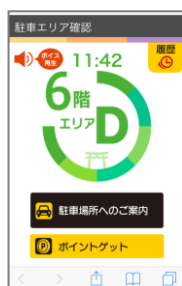
⑥ 画面左上の「ボイス再生」をタップし人気DJの運転アドバイスを聴く