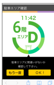
⑤ 駐車エリアを確認し、「OK!」をタップ