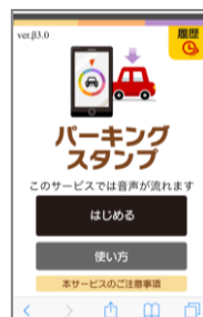
③ 専用ページの「スタート」をタップ