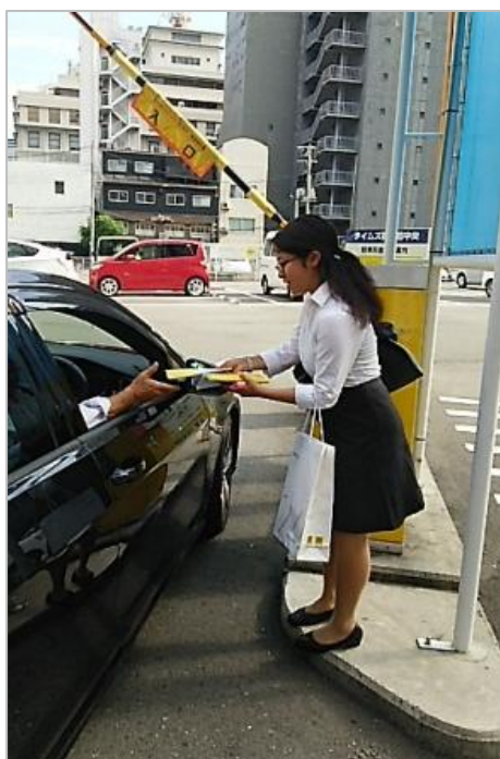
【タイムズ駐車場でのタイムズ MAP 配布活動①】