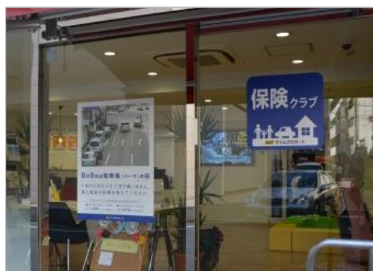
【「保険クラブ」店頭でのポスター掲示】