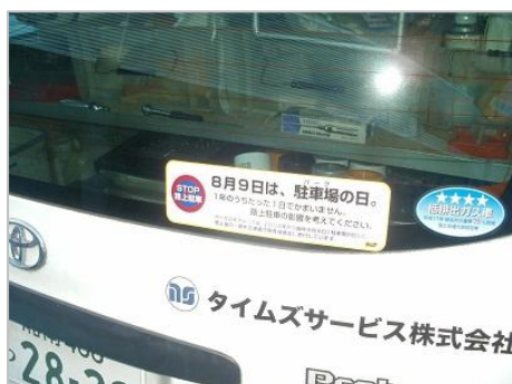
【作業用車両へのステッカー貼付】