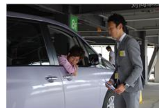
「タイムズレッスン」イメージ

https://www.timesclub.jp/member/view/open/tdlesson/list.jsp