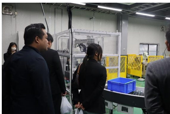
設備保全研修（電気・機械・物流）を見学する視察団の皆さん