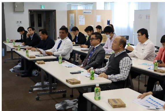
当社の研修施設テクノセンターの説明を受けてい る視察団の皆さん