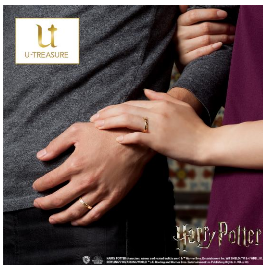
(写真/右) 【ハリー・ポッター】Golden Snitch Ring 物語の中に登場する「クイディッチ」のゲームで重要な意味をもつ“金のスニッチ”をイメージしたリング。

<本件に関する報道機関からのお問い合わせ先> 株式会社ケイ・ウノ自由が丘オフィス 広報/TEL.03-5731-7847 FAX.03-5731-7852 担当：川村 press@k-uno.co.jp、050-3771-5870