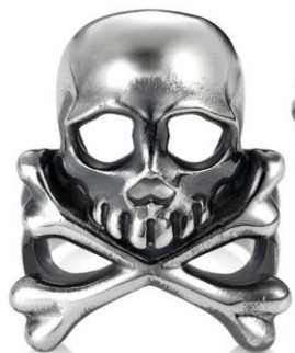
©LELJI MATSUMOTO・TOEI ANIMATION・PRODUCE BY ZERO GOODS UNIVERSE