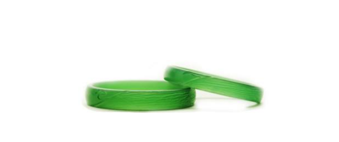
4、指輪の原型が完成

かかる経緯により、このほど、専門学校ヒコ・みづのジュエリーカレッジ、山脇美術専門学校ジュエリーデザイン科の4月入学者向けに無償で、棒状ワックスを135本提供します。