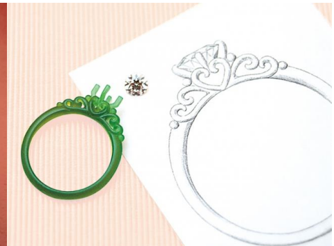
製作されたジュエリーの原型例