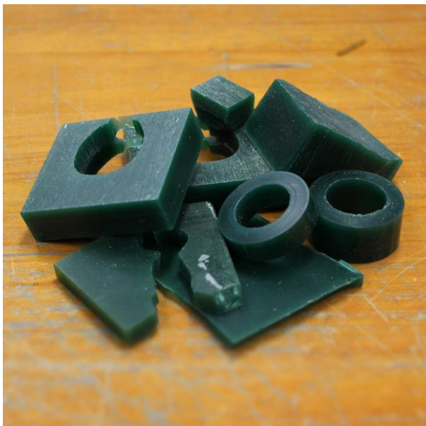
ジュエリー製作過程において出たワックス端材

様々なデザインが可能な「ワックス」というロウ素材を使用して、ジュエリーの原型を製作する加工方法があります。ケイ・ウノでは、ジュエリー製作においてワックスを使用し、加工過程で端材が出るため、再利用を研究しています。自社の職人研修ほか、ジュエリーの専門学校などで、ワックス加工の実技講義や実習の指導を実施していることから、未来の職人育成に役立て、ものづくり業界の活性化に貢献していきたいと考えています。