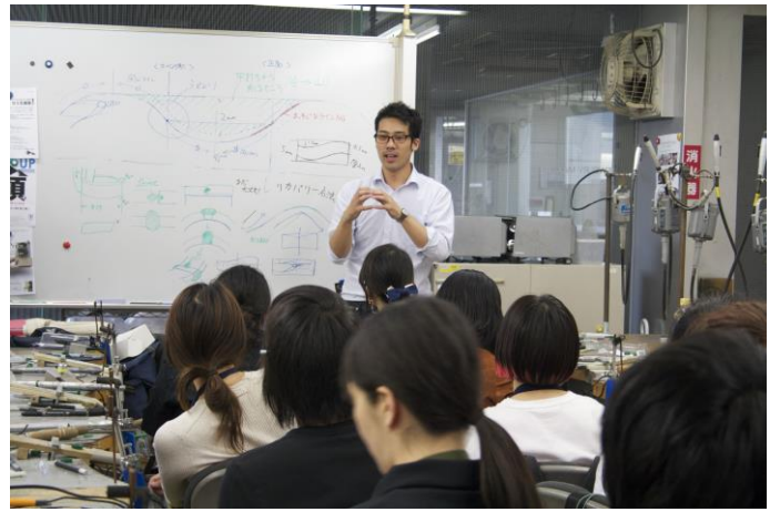
2017年7月、専門学校ヒコ・みづのジュエリーカレッジで行ったワックス加工の実技講義 風景

またケイ・ウノでは、一般のお客さま向けに、店舗に併設された工房で、DIY（手作り体験）サービスを提供しています。職人が丁寧にサポートするため、ものづくりが初めての方でも安心してジュエリー製作できます。