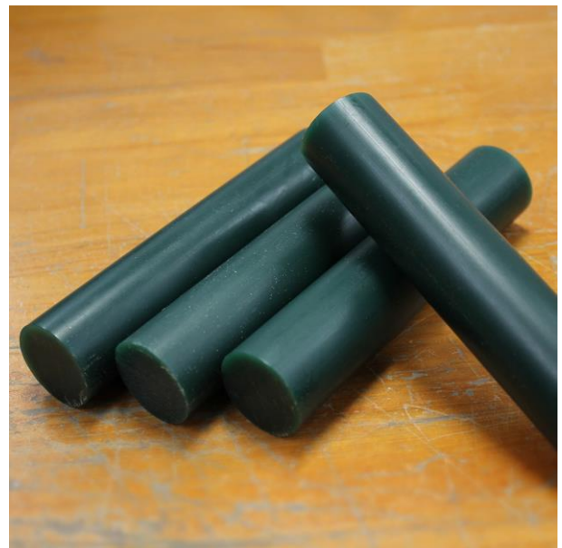
再利用した棒状ワックス