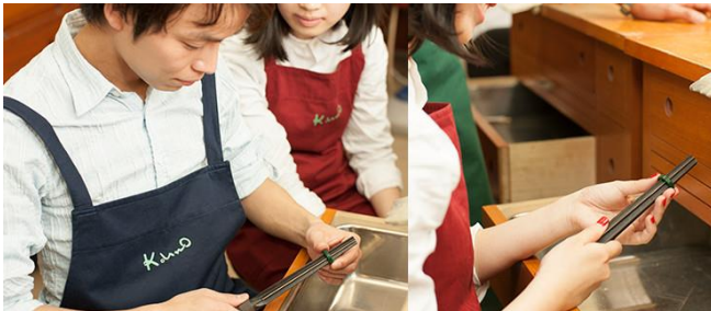
1、ワックスの内側を削り、指のサイズに合わせる