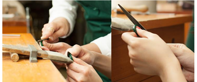
2、ヤスリを使って寸法を合わせる