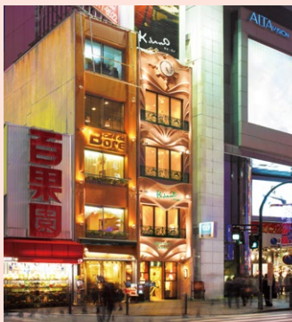
名古屋栄店に続き、 自社ビル2店舗目の新宿東口店。 2009年にオープン