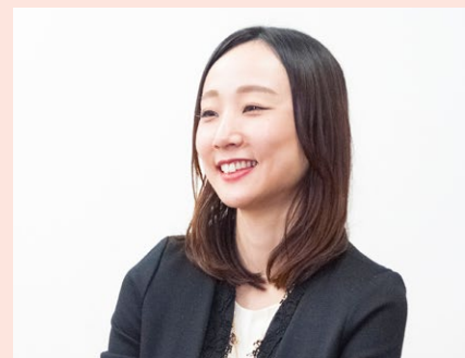
取材中も柔らかな笑顔を絶やさない

玉江 はい。ケイ・ウノ在社当時から妹のように可愛がってくれた先輩を頼りまして(笑)。そうしたら、ちょうど新宿東口にビル1棟買って新店をオープンするから人を採用したいと。心底驚きました。世の中が不景気にあえいでいる時に、なんとという会社なんだらうって。