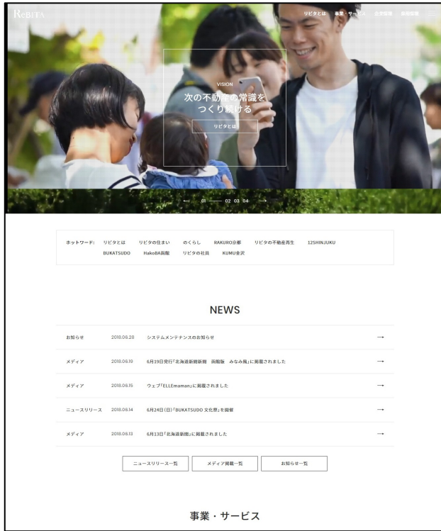
▲リビタコーポレートサイト