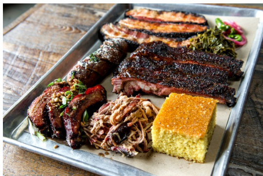
▲提供料理イメージ

バーベキュー場やキャンプ場の運営を展開する株式会社ヒーローがマイクロブルワリーを併設したレストランをプロデュースします。「スロースモークバーベキュー」をテーマに長時間手間暇かけて調理したブルドポークやスペアリブをはじめ、塊肉や築地直送の旬の野菜や魚介、シーズニングやマリネードにこだわり素材の持つ旨みを引きだし、豪快かつ美味しいメニューをご提供いたします。