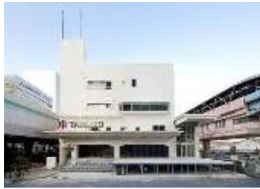
オフィス商業複合施設「TABLOID」 www.tabloid-tcd.com/