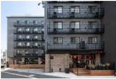
原宿神宮前「THE SHARE」 www.the-share.jp/