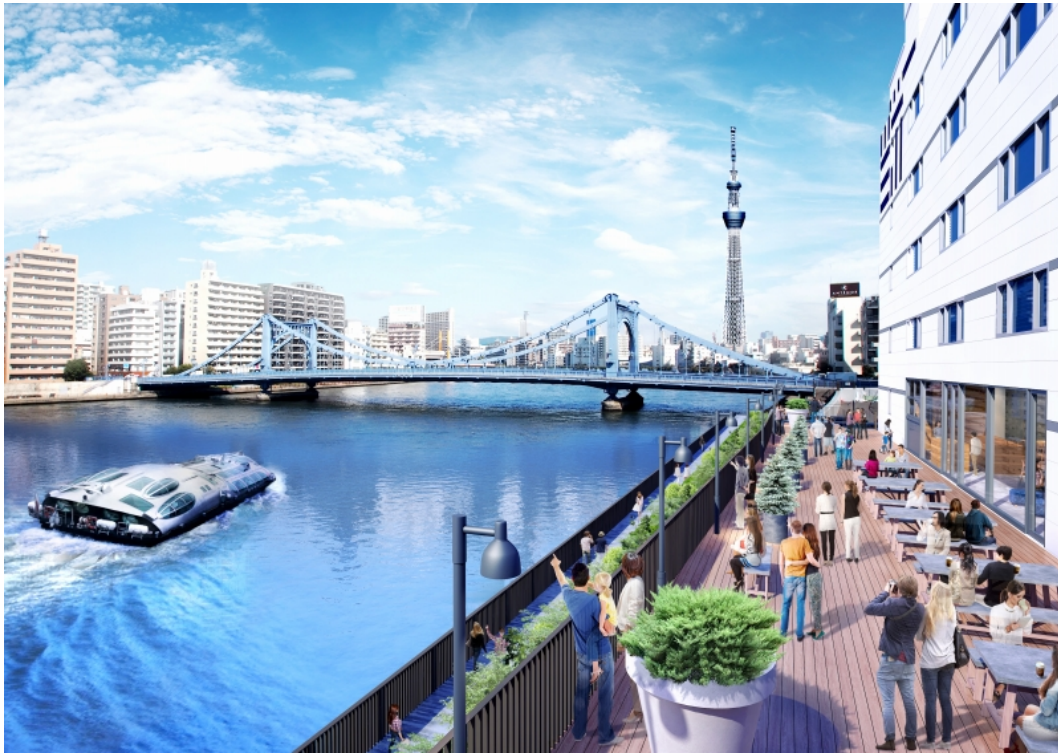
▲LYURO 東京清澄から見える水辺の景色および、かわてらすデッキイメージ

* “かわてらす”出店事業者としては4事例目。「誰もが利用可能なまちに開放されたオープンスペース」としての事例は初。