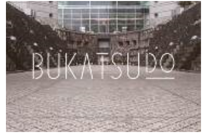
街のシェアスペース「BUKATSUDO」 bukatsu-do.jp