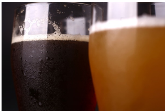
▲クラフトビールイメージ

素材、製法ともにこだわり、ビール造りの原点への回帰、本物の味を追求する「アウグスビール」初のブルワリーが誕生します。醸造士と言われる、ビール造りの職人が丹精込めて作り上げる本物のビールをご堪能いただけます。清洲橋オリジナルクラフトビールをはじめ、アウグスオリジナルや谷中ビールなど様々なクラフトビールをバーベキュー料理とともに楽しみいただけます。