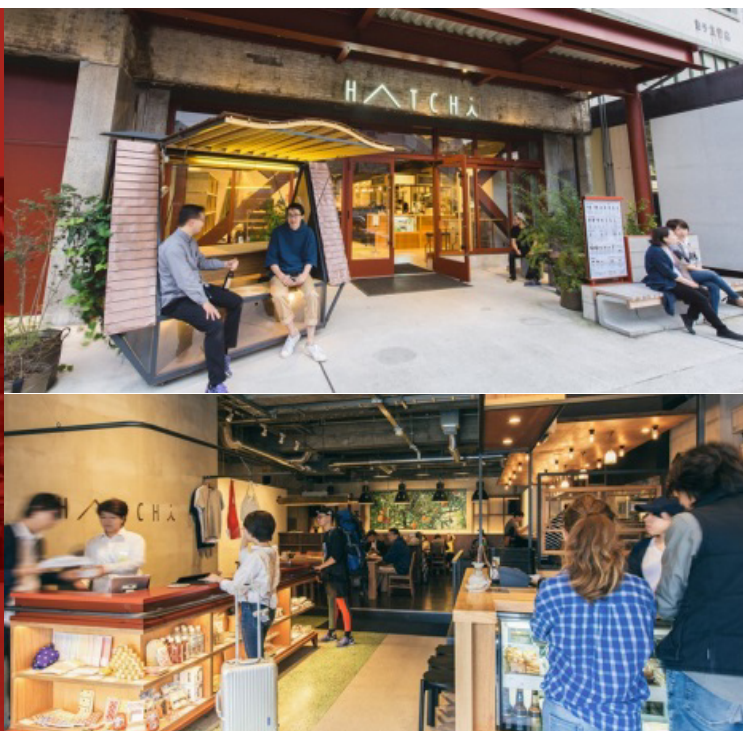
▲ (右上) HATCHi 金沢外観 / (右下) エントランス