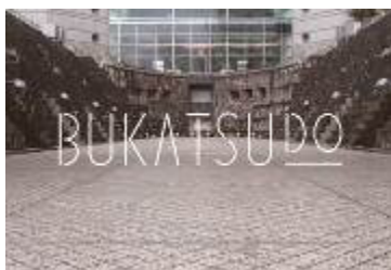
街のシェアスペース「BUKATSUDO」 bukatsu-do.jp/