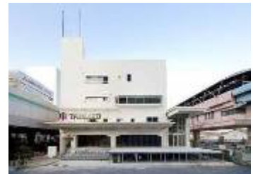
オフィス商業複合施設「TABLOID」 www.tabloid-tcd.com/