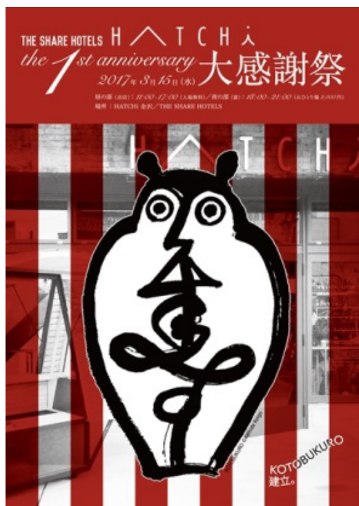
▲ (左) 「HATCHi 金沢 1周年大感謝祭」フライヤー

2017年3月30日には「THE SHARE HOTELS」の第二号店「LYURO 東京清澄」が開業を控えるほか、春には北海道函館市、夏には金沢二号店の開業に向けた準備をすすめております。今後も、一号店のある金沢をはじめ、その場所にしかない出会いや体験があふれる、まちに根差したホテルを展開してまいります。