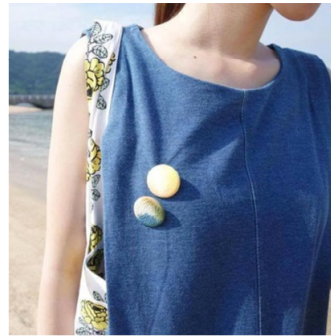
▲五箇山和紙でつくるピンバッヂ