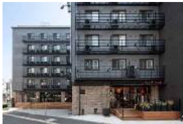
原宿神宮前「THE SHARE」 www.the-share.jp/

名称：株式会社リビタ 設立：2005年（2012年より京王グループ） 代表取締役社長：都村 智史 住所：東京都渋谷区渋谷 2-16-1 URL： www.rebita.co.jp