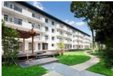
築50年のUR団地再生「りえんと多摩平」 www.share-place.com/tamadaira.shtml