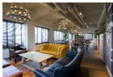
シェア型複合施設「the C」 the-c.tokyo/