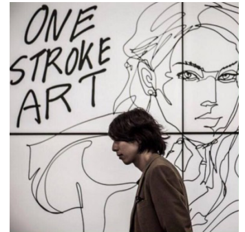
▲一筆書き似顔絵"One Stroke Art"