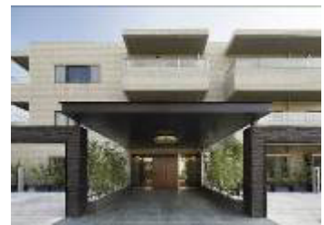
100平米超マンション「R100 TOKYO」 r100tokyo.com/