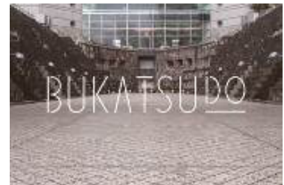
街のシェアスペース「BUKATSUDO」 bukatsu-do.jp