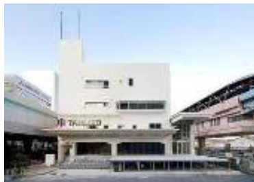
オフィス商業複合施設「TABLOID」 www.tabloid-tcd.com/