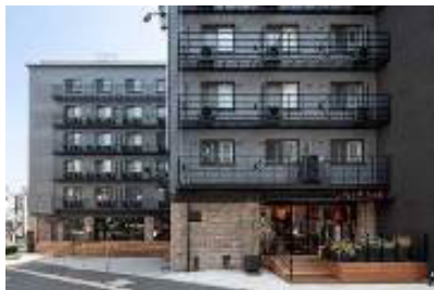
原宿神宮前「THE SHARE」 www.the-share.jp/