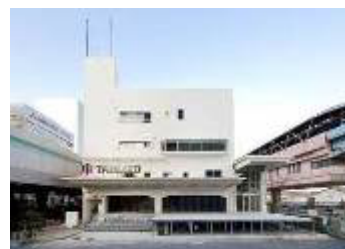
オフィス商業複合施設「TABLOID」