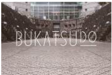
街のシェアスペース「BUKATSUDO」