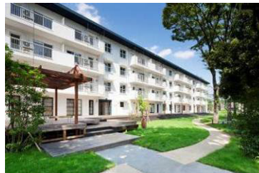
築50年のUR団地再生「りえんと多摩平」 http://www.share-place.com/tamadaira.shtml