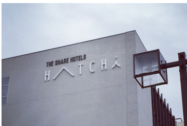
シェア型複合ホテル 「THE SHARE HOTELS」 http://www.thesharehotels.com