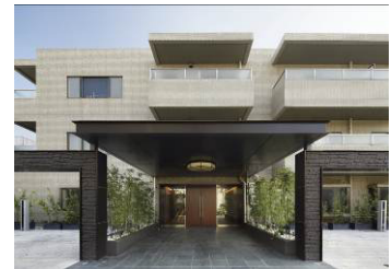
100平米超マンション 「R100 TOKYO」 http://r100tokyo.com