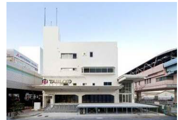
オフィス商業複合施設「TABLOID」 www.tabloid-tcd.com