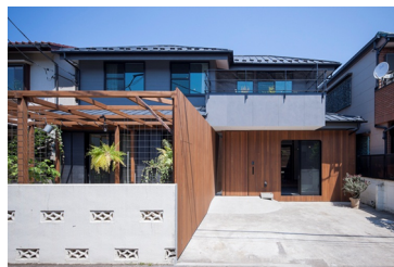
戸建てリノベーション 「HOWS Renovation」 http://hows-renovation.com