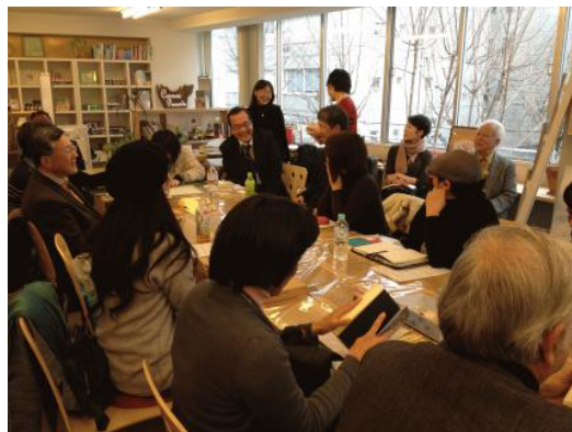
まちライブラリー開催イメージ