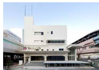
オフィス商業複合施設「TABLOID」