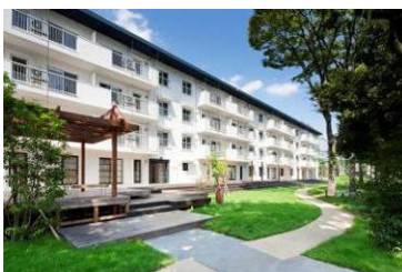
築50年のUR団地再生「りえんと多摩平」