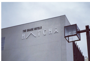
シェア型複合ホテル「THE SHARE HOTELS」